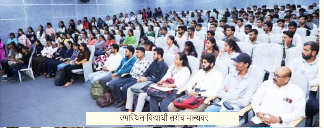
उपस्थित विद्यार्थी तसेच मान्यवर