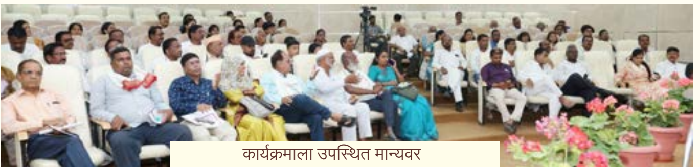
कार्यक्रमाला उपस्थित मान्यवर