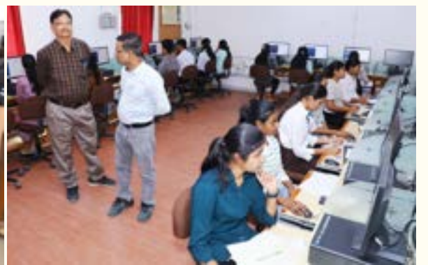
परिक्षा देतांना विद्यार्थी