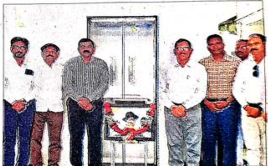
Dignitaries offering tributes to Shahid Bhagat Singh, Rajguru and Sukhdev.