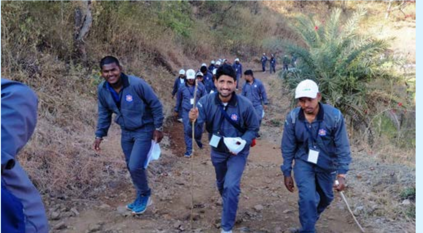
ट्रेकिंग करतांना विद्यार्थी