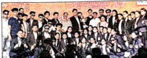
विद्यापीठाची चमू आपल्या प्राथिण्यांकरिता

रांगोळी, हिंदी शब्दतुल्य स्पर्धा, मिमिक्री, वेस्टर्न व्होकल सोलो या कलाप्रकारात प्रथम पारितोषिके, भारतीय समूहगान, शास्त्रीय नृत्य, वेस्टर्न इन्स्ट्रुमेंटल सोलो या कलाप्रकारात द्वितीय व माईम, कल्चरल प्रोसेशन या कलाप्रकारात तृतीय तसेच लोकनृत्य, फोक अर्किस्ट्रा, ग्रुप सॉंग वेस्टर्न या कलाप्रकारात चवथे आणि कले मॉडेलिंग