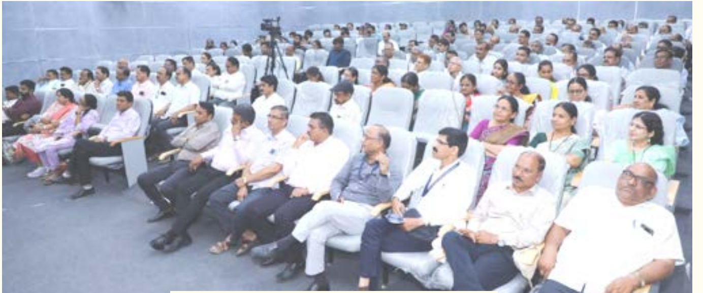
कार्यक्रमाला उपस्थित मान्यवर