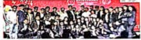
साथीदार व चमू व्यवस्थापक यांच्या परिश्रमाने ३९ व्या अखिल भारतीय राष्ट्रीय युवा महोत्सव स्पर्धेत अमरावती विद्यापीठाला पंचपवीत यश मिळाले.

विद्यार्थी विकास विभागांतर्गत विद्यार्थ्यांच्या सर्वांगीण विकासाकरिता मोठ्याप्रमाणात सांस्कृतिक महोत्सवाचे आयोजन करण्यात येते. त्यामधून अनेक प्राथिण्याप्राप्त विद्यार्थी कलाक्षेत्रात उत्तुंग भरारी घेऊन अमरावती विद्यापीठाचा नावलौकीक करीत आहे. ही अत्यंत अभिमानास्पद बाब असून, सर्व विद्यार्थी कलावंत,