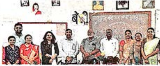
निबंध स्पर्धेत विजेते विद्यार्थी मान्यवरोसह उपस्थित आदी.

स्त्री शिक्षणाची जन्नी : सावित्रीबाई फुले या विषयावर घेण्यात आलेल्या निबंध स्पर्धेत विभागातील विद्यार्थ्यांनी मोठ्या उत्साहाने सहभाग नोंदवून सावित्रीबाई यांच्या कार्याचा अभ्यासपूर्ण आढावा आपल्या निबंधांमधून मांडला. स्त्री शिक्षणासाठी सावित्रीबाई फुले यांनी केलेले कार्य, समाजातील अन्यायकारक प्रथांविरुद्ध