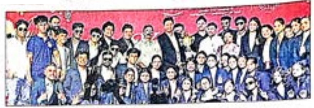
SGBAU students celebrating success.

The university's cultural initiatives, under the Student