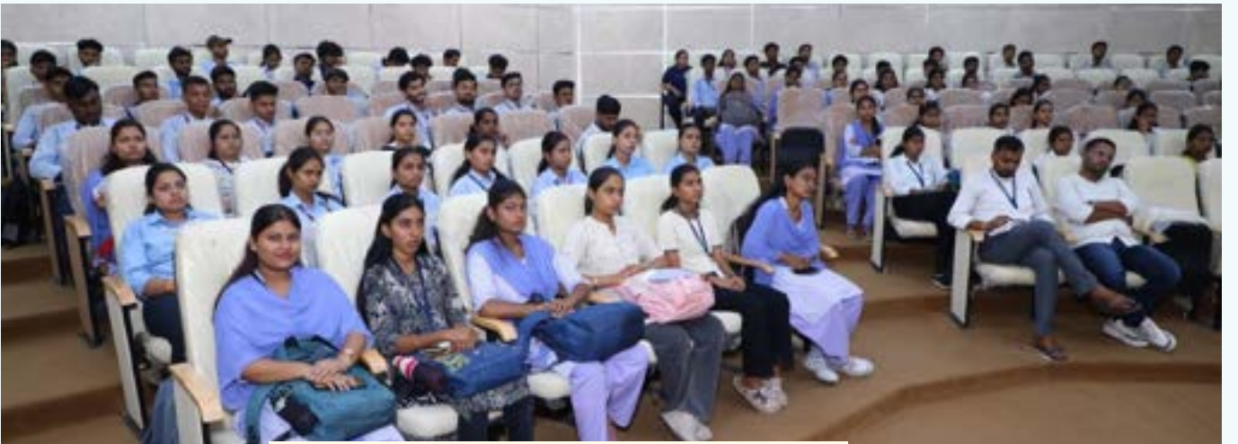
उपस्थित विद्यार्थीनी व विद्यार्थी