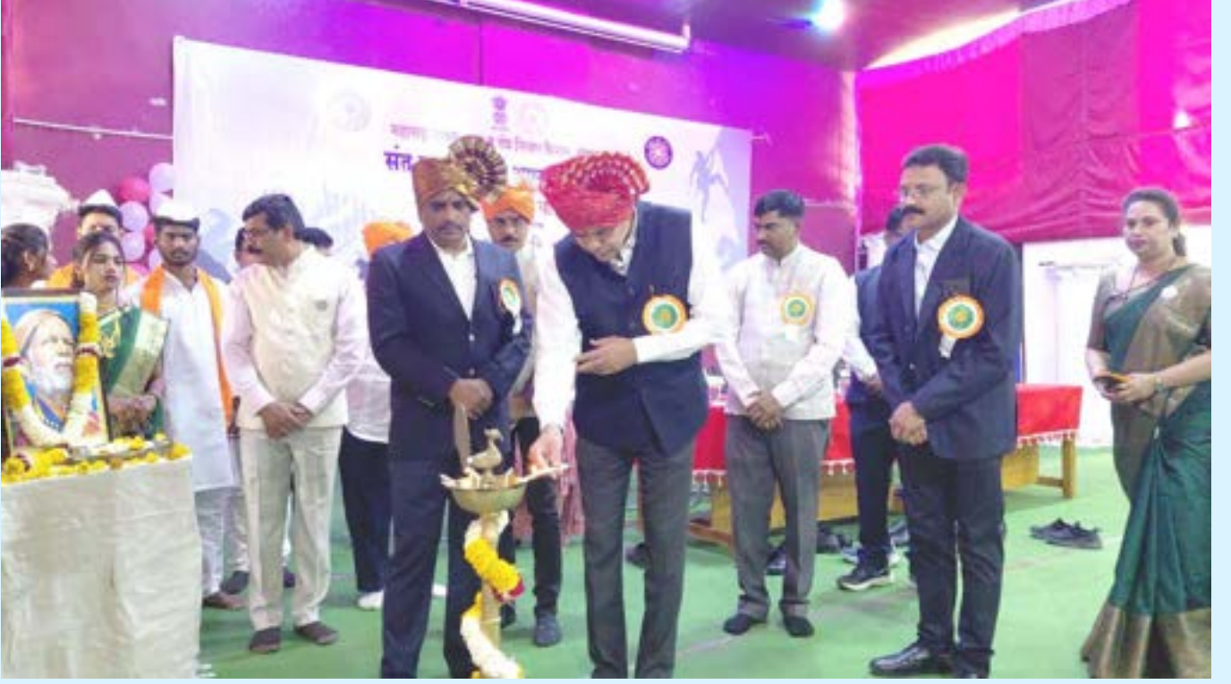
दीपप्रज्वलन करतांना मान्यवर

कार्यक्रमाच्या सुरुवातीला पारंपरिक पोशाख परिधान करून आदिवासी बांधवांनी आदिवासी गदली नृत्य सादर करीत मिरवणुकीद्वारे प्रमुख पाहुण्यांचे स्वागत करण्यात आले. त्यानंतर संत गाडगे बाबा यांच्या प्रतिमेचे पूजन आणि दीपप्रज्वलन, महाराष्ट्र गीत, विद्यापीठ गीत आणि रासेयो लक्ष गीताने कार्यक्रमाची सुरुवात झाली. प्रमुख पाहुण्यांचा सन्मानचिन्ह आणि ग्रामगीता देऊन सत्कार करण्यात आला. जागतिक महिला दिनानिमित्त