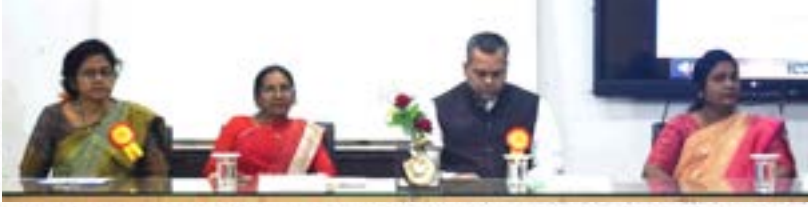
भास्कर डेस्क | अमरावती.

■ विश्वविद्यालय के स्वास्थ्य केंद्र और प्राणी विज्ञान विभाग का संयुक्त उपक्रम